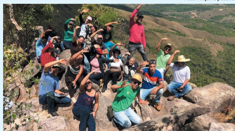
Alunos do curso Técnico em Meio Ambiente durante visita técnica

Fruto de uma parceria entre a Escola Técnica de Saúde da Universidade Federal de Uberlândia (Estes/UFU) e a Escola Estadual de Uberlândia (Museu), o curso de Técnico em Meio Ambiente está com matrículas abertas, até o dia 25 de fevereiro. Integrado ao Ensino Médio do Programa Nacional de Integração da Educação Profissional com a Educação Básica na Modalidade de Educação de Jovens e Adultos (Proeja), trata-se de uma oportunidade de qualificação profissional que pode beneficiar jovens e adultos, trabalhadores e estudantes, com idade igual ou superior a 18 anos e que concluíram apenas o Ensino Fundamental.